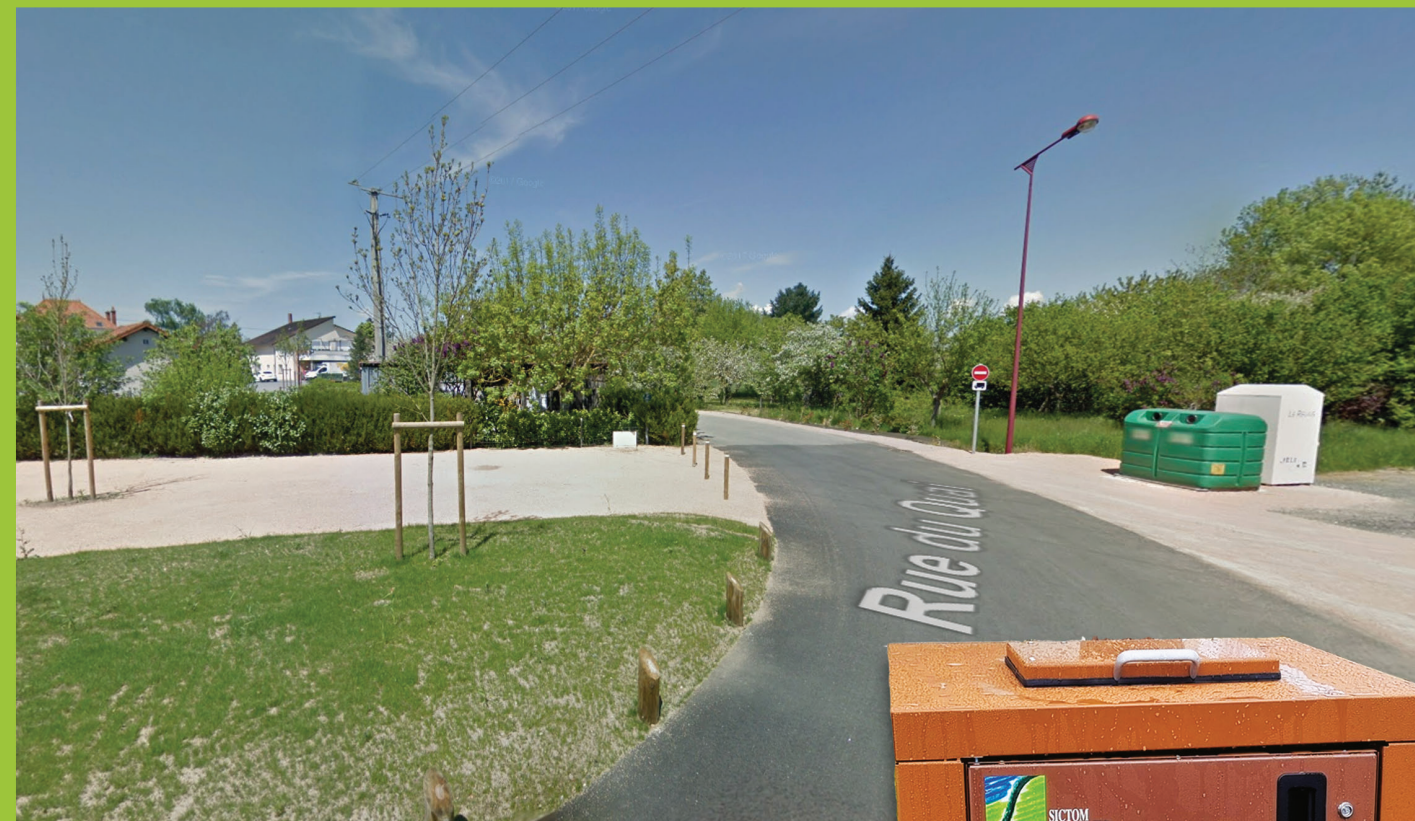
Rue du Quai